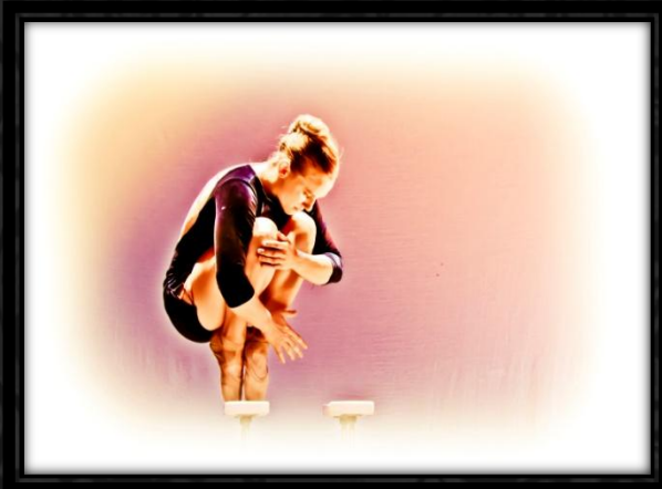
Equilibre on Points.