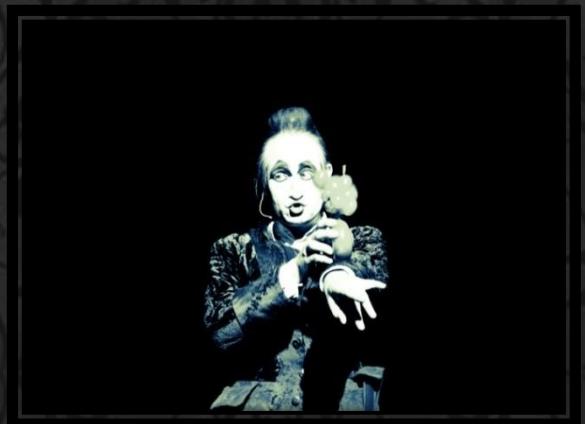
Spaziergang in die Gärten von Versailles.