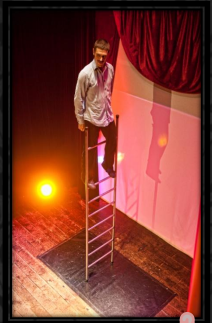
Der Diener steigt auf.

„La Cour ein königliches Varietiespektakel“ ist eine Produktion von Stephan Masur/ Ewaldstraße 14/ 50670 Köln Mobil 0177 6554433 s.masur@varietiespektakel.de/ www.varietiespektakel.de