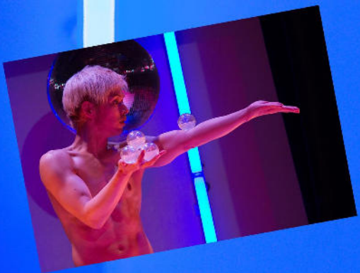
Maro - Jonglage