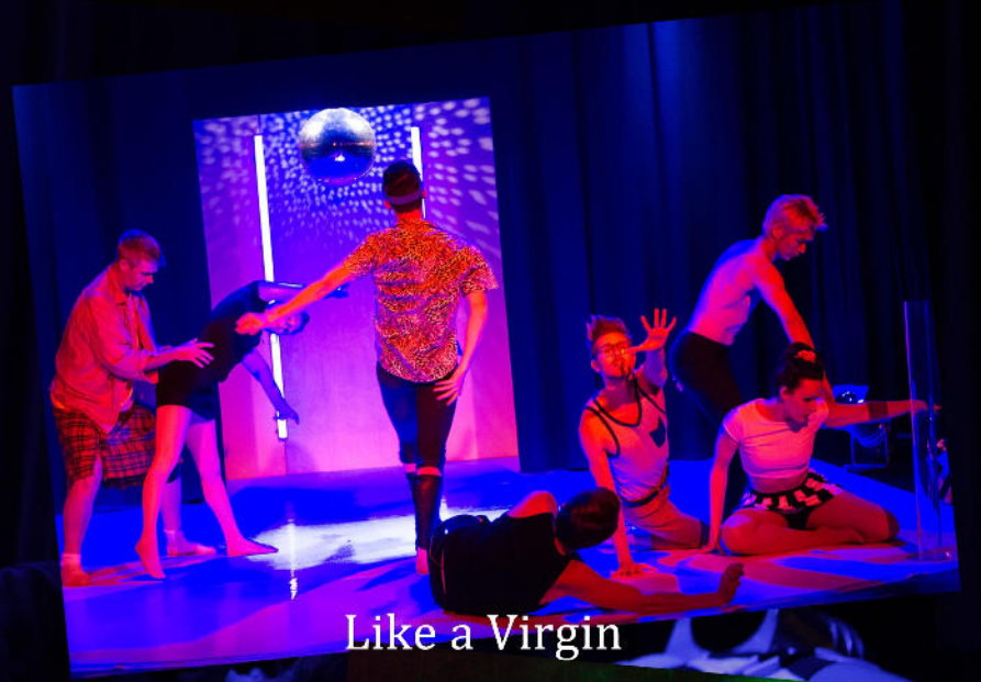
Like a Virgin