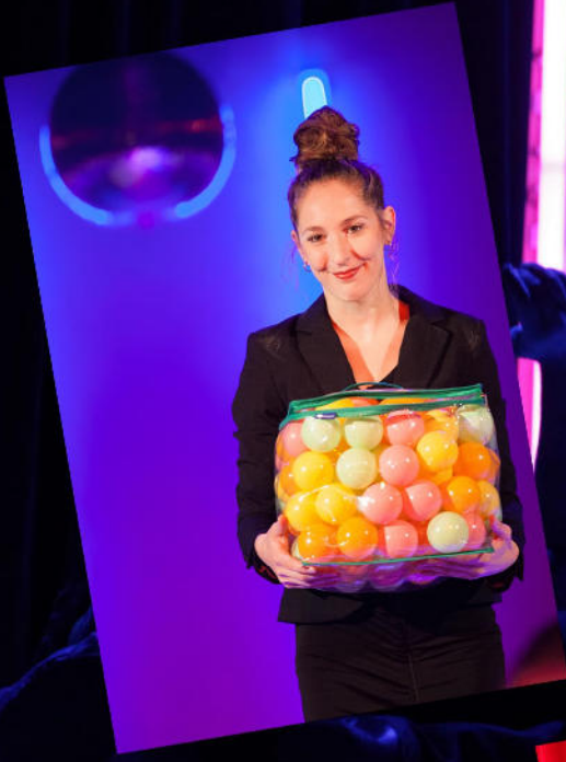
Running up that Hill