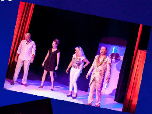
Time of My Life